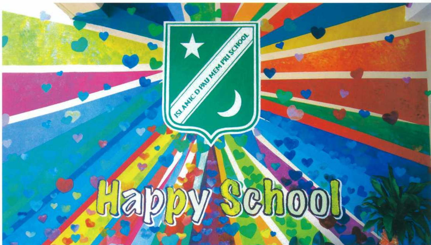
學校於校園內特設寫上 Happy School 字眼的七彩繽紛壁畫，激發學生學習興趣。